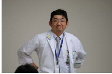
9日(火) 『胸部単純写真』 放射線科 大野 良治先生