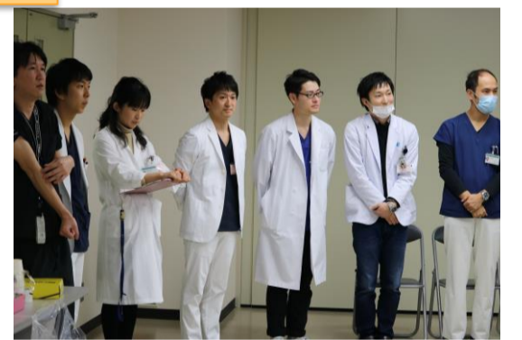
熱い指導をして下さった先生方!!