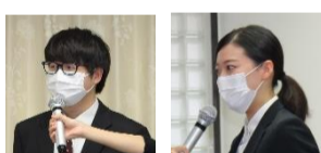
先生方からも簡単な自己紹介をいただきました。