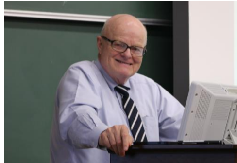
11/6(火)～11/8(木) カリフォルニア大学サンフランシスコ校教授 LAWRENCE M TIERNEY Jr.先生