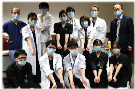
相互採血をがんばった自分の腕と笑顔で記念撮影