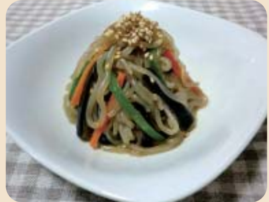
※写真の盛付けは1人分です。

本来、韓国料理のチャプチェには春雨を使いますが、今回はその代わりに糸こんにゃくを使用しています。ごま油の風味が程よく効いており、豆板醤のピリッとした刺激がアクセントとなった1品です。どうぞ、お試しください。