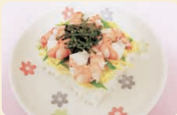
※写真は直径16cmの食器で、盛り付けは1人分です。

酢飯は砂糖も多く使われており、血糖の上昇も気になるところ。そこで、今回は砂糖の代わりに低エネルギー甘味料を使用し、さらにこんにゃく米入りのご飯を使用した低エネルギーのちらしずしをご紹介します。どうぞ、お試しください。(こんにゃく米はスーパー等の米売り場にありません。種類が分かりにくい場合は、管理栄養士にご相談ください。)