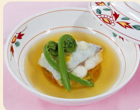
※写真のお皿は17cm×17cm、盛り付けは1人分です。