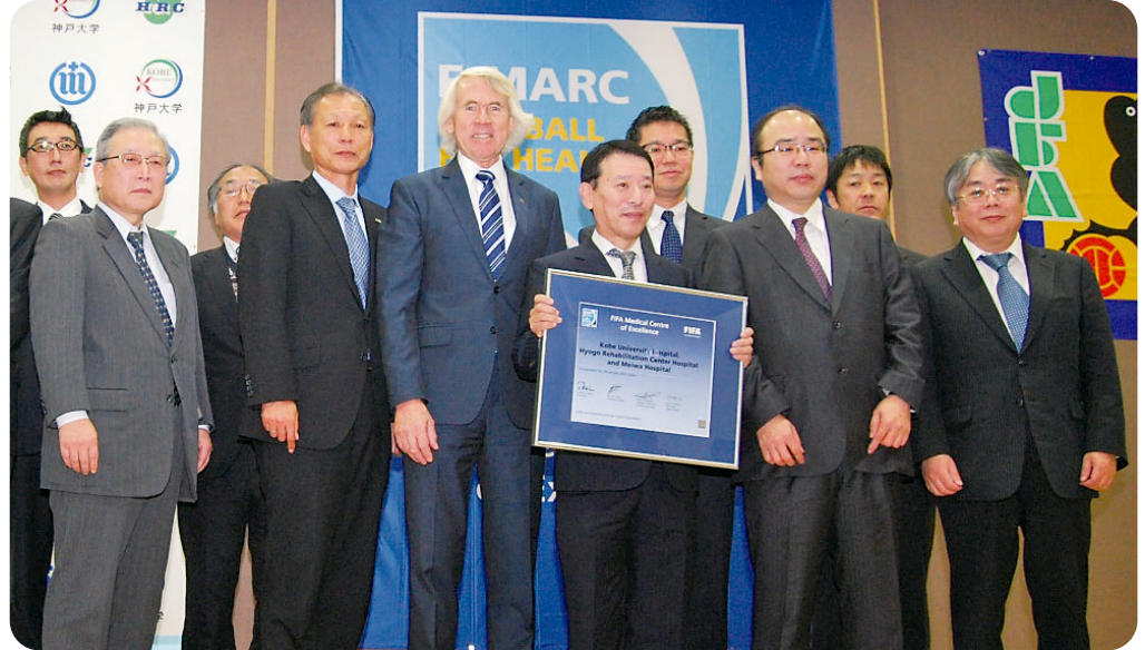
FIFAチーフメディカルオフィサーのシリ・ドヴォラック氏と(右から6番目)