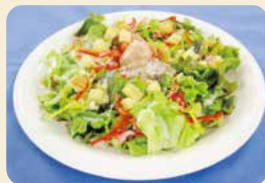
※写真のお皿は直径25cm、盛り付けは1人分です。

はじめじめとした梅雨が明けると、いよいよ夏本番です。そんな季節にはサッパリとしたお料理はいかがでしょう。今回は「鯛のカルパッチョサラダ」をご紹介します。色とりどりのサラダは見た目にも食欲をそそり、ボリューム満点で嬉しい一品です。ぜひご家庭でもお試しください。