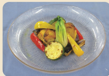
※写真のお皿は直径20cm、盛り付けは1人分です。

漬け込みに時間がかかりそうなタンドリーチキンですが、身近な調味料で手軽に、短時間で作れるレシピをご紹介します。ぜひご家庭でもお試しください。