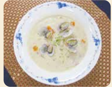
※写真のお皿は内径16.5cm、盛り付けは1人分です。

今回は寒い日に食べたくなる「クラムチャウダー」をご紹介します。 ぷりぷりなあさりの旨味がよく染みわたる絶妙な美味しさのスープです。牛乳や生クリームの代わりに豆乳を使用することで、よりヘルシーで濃厚なまろやかさを出すことができます。ランチや急なおもてなし料理にもおすすめのお手軽な一品です。