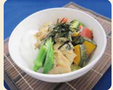
※写真のお皿は直径14cm、盛り付けは1人分です。

パサパサが気になる鶏むね肉も切り方や調味料を一工夫するだけで柔らかく仕上がりに、にんにくで食欲もそそります。ぜひご家庭でもお試しください。