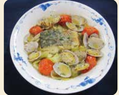
※写真の器は直径20cm、盛り付けは1人分です。

この一品で1日に必要な野菜の約1/2量を摂取することができるので、野菜が不足がちな方にもおすすめです。 ぜひご家庭でもお試しください。