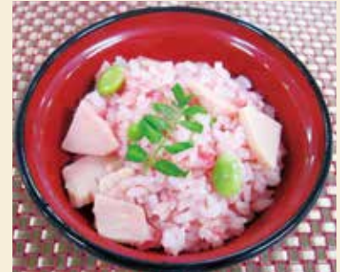
※写真の器は直径14cm、盛り付けは1人分です。

出来上がりも華やかで春の訪れを感じさせてくれることから、おもてなし料理としても最適です。最近注目されているもち麦のヘルシーな食感もお楽しみいただけます。ぜひお試しください。