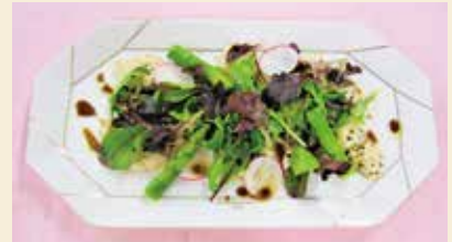
※写真のお皿は16cm×30cm、盛り付けは1人分です。

新緑の爽やかな季節となりました。今回は旬の野菜、アスパラガスやラディッシュを使った色鮮やかなサラダをご紹介します。深いコクと上品な酸味が特徴のバルサミコ酢をドレッシングに用いることで、おもてなし料理の前菜にもぴったりで食欲をそそる一品となります。またこのドレッシングは肉類や魚介類とも相性が良く、主菜もしっかり摂ることができます。ぜひお試しください。