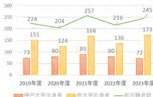
出願者数の推移 (5年間)