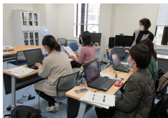
《電子カルテシステムの研修の様子》