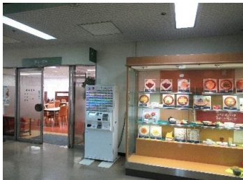
一般食堂・喫茶 平日9:00~17:00ラストオーダー