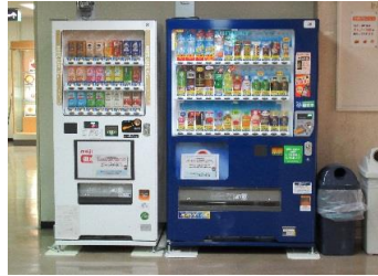
自動販売機コーナー