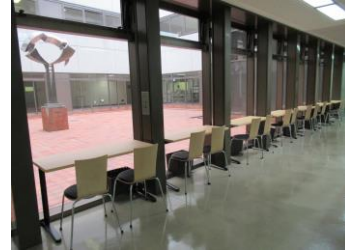
イートインコーナー (フリースペース) 飲食の持ち込み可