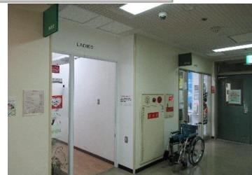
理容室・美容室 平日: 9:00~18:00 日・祝: 10:00~18:00