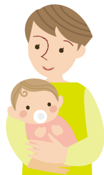
図：妊娠、出産にむけての内服についての計画と注意点

A 出産後は夜間の授乳など、とても疲れるものです。 一人で育てようと思わずに応援してくれる人や体制を作りましょう (図の②)。夫や親、友人、その他、出産後のサポートをしてくれるところをあらかじめ探しておきましょう。また母乳の中に抗てんかん薬が入って赤ちゃんに良くないのではと心配される方がおられますが、原則的には問題がないとされています。ただ薬の種類や量、ご本人の状態により差がありますので、心配があれば主治医の先生や看護師さんに相談してください。 何よりもあなた自身のてんかんの治療を継続し育児に不都合な発作をコントロールすることが赤ちゃんを心配なく育てることにつながります。