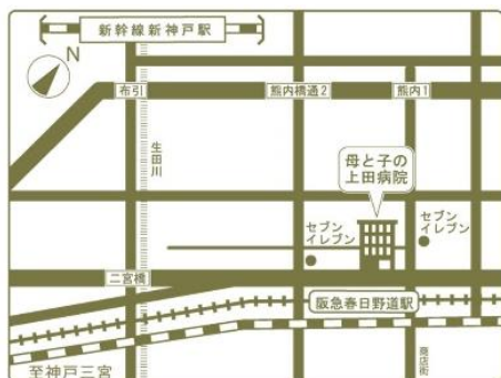
阪急春日野道より北へ徒歩1分

当院は、阪急三宮駅より一駅の【阪急春日野道駅】目の前にある病院です。生まれて直ぐの赤ちゃんから保護者の付き添いがあれば年齢が大きくなったお姉ちゃん・お兄ちゃんまで、予防接種、発達障害、病気、その他アレルギー等のお子さんでお困り事は何でも相談を受けて診療をする病院です。詳しくは母と子の上田病院ホームページをご覧ください、気軽にご相談下さい。